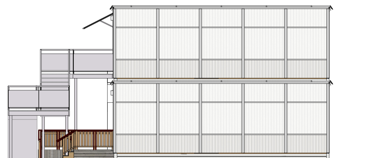
Gavelsida höger 1:100