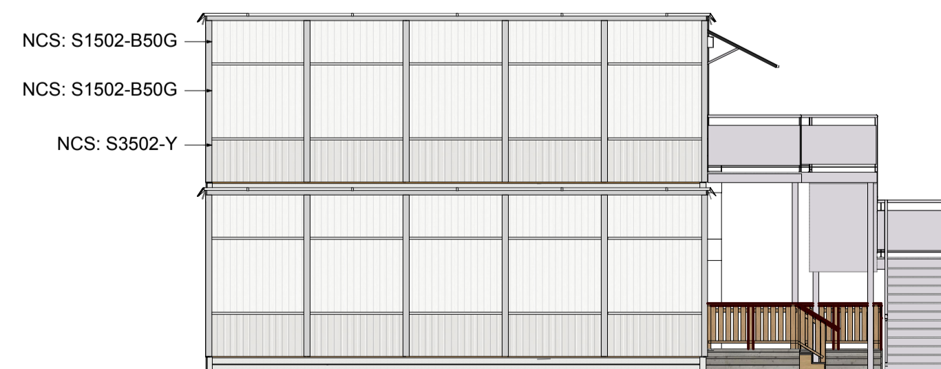
Gavelsida vänster 1:100

Ritningen är skyddad enligt upphovsrättslagen och får inte kopieras, spridas eller lösligt användas utan upphovsmannens medgivande.